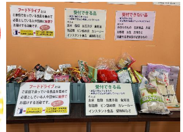
▲フードドライブの様子