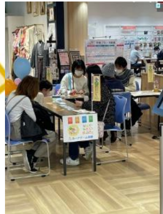
▲「なんでやろう？食品ロスカードゲーム」の様子