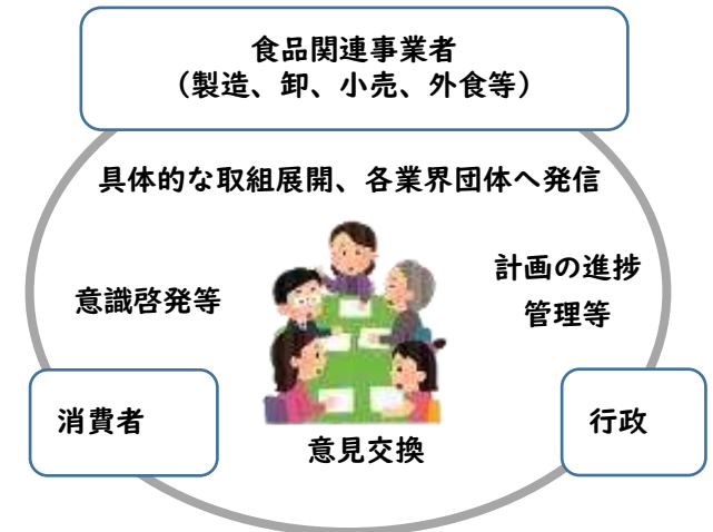
ネットワーク懇話会のイメージ

→これらを踏まえ、府として、事業者との取組等を通じ、原材料となる未利用食品・販売事業者等のマッチング、アップサイクルフードの魅力発信などについて協力していきます。