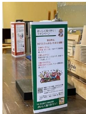
▲食べきりを促す三角柱による呼びかけ