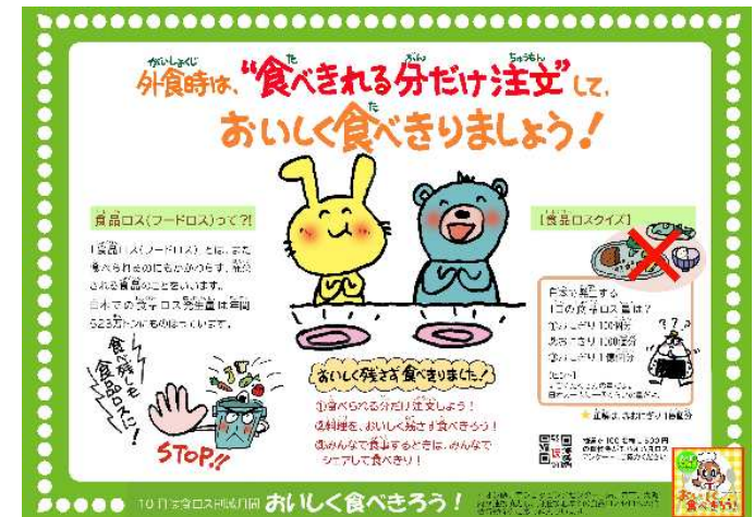
▲食べきりを促すトレイシートによる呼びかけ