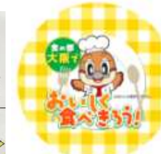
▲缶バッジのデザイン