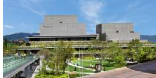
【図2】おおさか気候変動対策賞特別賞（愛称：“涼”デザイン建築賞） （特別賞6件の1例） 枚方市総合文化芸術センター