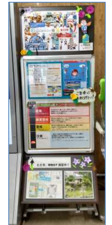
【図3】WBGT（暑さ指数計）の電光表示パネルの設置