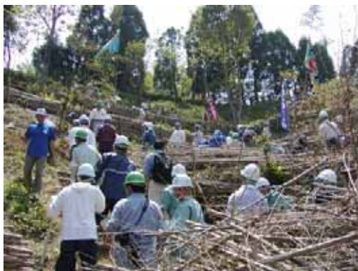
<魚庭（なにわ）の森づくりの様子>