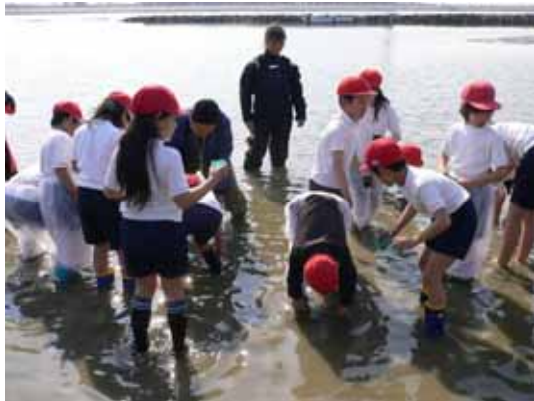
<アマモの移植の様子>