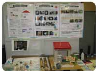
< 雨水利用出前講座用教材 >