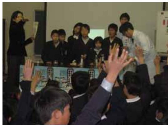
< 小学校での出前講座の様子 >