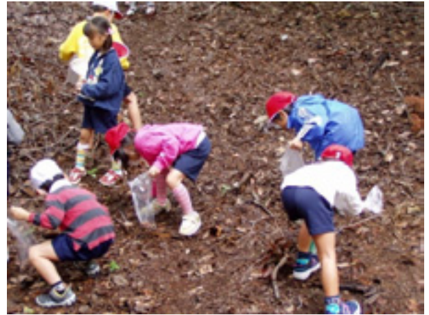
図-45 ドングリを拾う子どもたち

みどりを育てることの大切さを体験学習するため、子どもたちが集めたどんぐりを預かり、育てた苗木をみどり豊かなまちづくりのために植えてもらうという木になる夢銀行推進事業において、平成15年度は約5,000人の子どもたちに通帳を発行し、約200万個のどんぐりが集まりました。