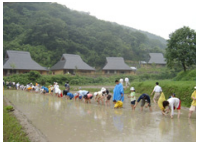
図-46 紀泉わいわい村

※10 紀泉わいわい村・・・環境と共生していた里山の暮らしを再現する自然環境学習拠点として、平成15年4月に開村。運営については、提案公募型のプロポーザル方式により決定した(財)大阪YMCAがNPO等との連携を図りながら行っています。