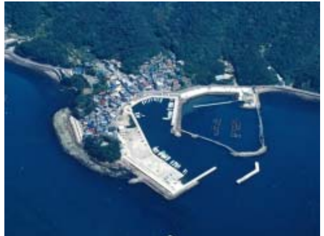
図 - 44 小島漁港航空写真

府民と漁業者との交流を促進する拠点の整備を目的に、深日漁港においては、親水機能をもたせた階段護岸の一部整備を行い、小島漁港においては、多目的広場等の基盤整備となる埋立等を行いました。