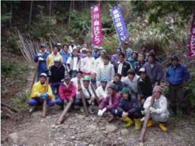
図 - 43 魚庭（なにわ）の森づくり事業