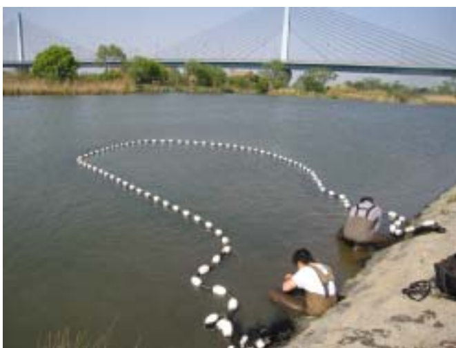
図 - 41 現地調査の様子（淀川城北ワンド）

淀川の本流及びワンド 145 地点で生息調査を実施し、魚類 34 種、水生植物 27 種が確認されるとともに、外来魚のブル - ギル、オオクチバス、外来植物のオオカナダモ、ボタンウキクサ等の出現割合が高くなっていることが判明しました。