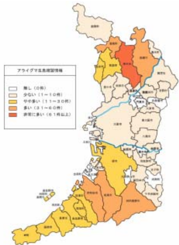
図 - 40 大阪府域における野生アライグマの出現状況