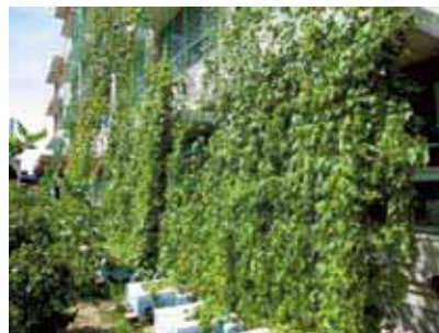
図-46 みどりのカーテン