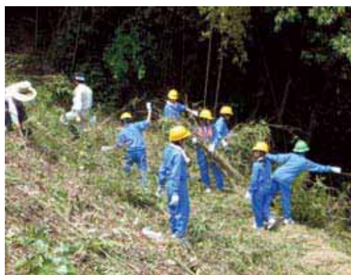
図-38 中学生による冒険の森づくり活動の様子