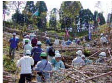
図-39 なにわの森づくりの様子