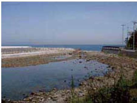
図-45 深日漁港における整備状況(干潟部)