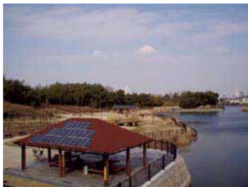
図-41 ため池オアシス(狭山副池)