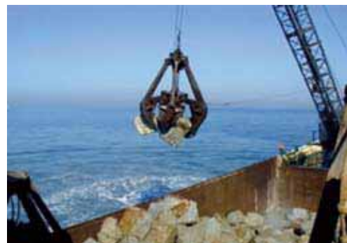
図-40 増殖場(藻場)の造成