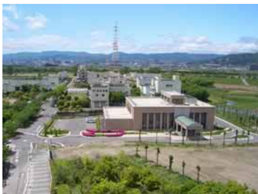
図-28 渚水みらいセンター