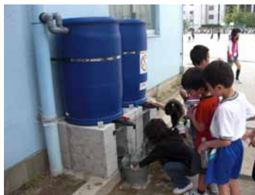
図-26 小学校での雨水利用