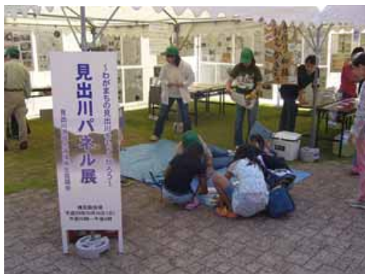
図-27 見出川パネル展の開催