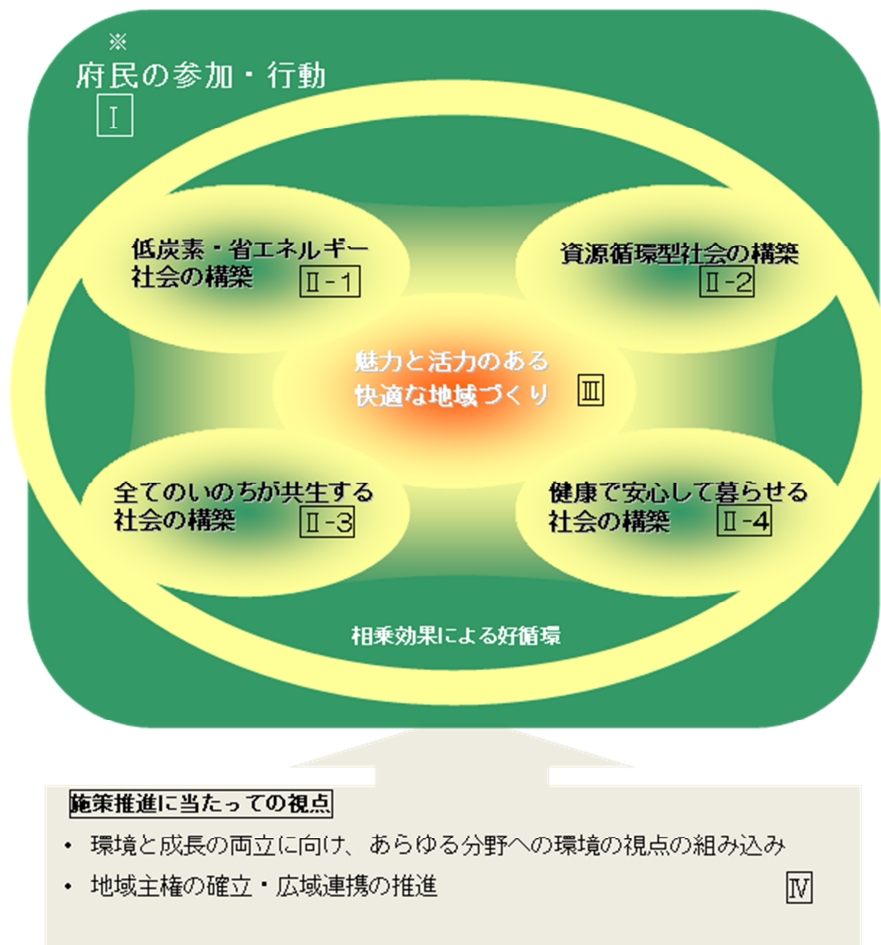
環境総合計画に定める各分野の関連についての概念図

また、環境総合計画に基づく進行管理の方法を検討し、新たな方法による計画の進行管理を実施しました。