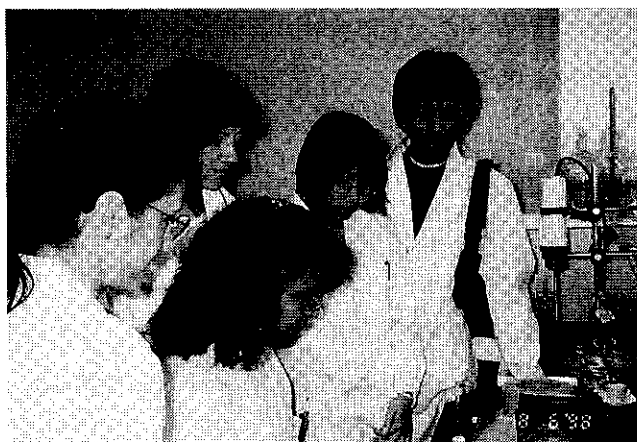
<研修風景（JICA「有害金属汚染対策コース」研修）>

JICAが行う「有害金属汚染対策コース」研修に対して、（財）地球環境センターとともに協力し、開発途上国からの研修生6名を約2か月間受け入れ、法令等の講義、分析実習等の研修を実施した。