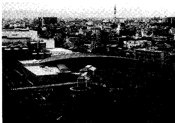
平成10年度 みどりの景観賞〔大阪府知事賞〕 アサヒビール株式会社吹田工場ゲストハウス