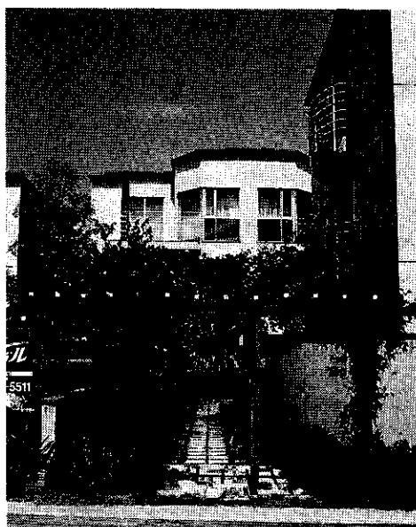
平成10年度 大阪まちなみ賞〔大阪府知事賞〕 PONT FICO