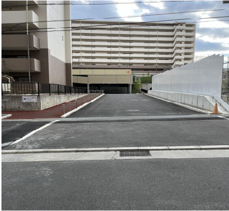
進入路を南に直進後、西に集会所