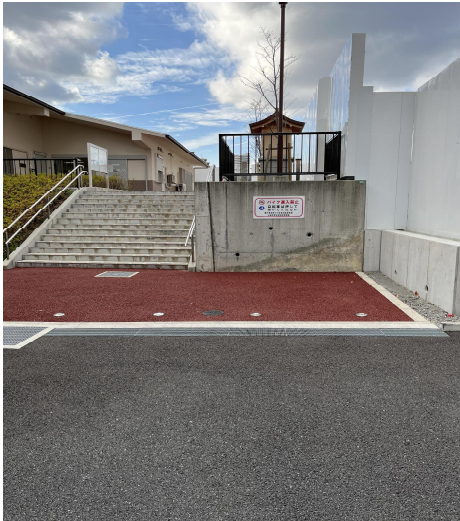
階段数 14 段、高低差約 2 m 以上、奥行約 4.4m、幅約 3.7m