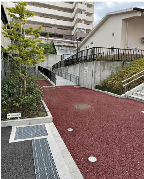
スロープあり。幅約 2 m