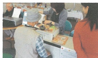
食育 SAT システムを 活用した栄養相談