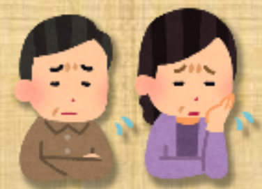
分譲マンションの管理組合