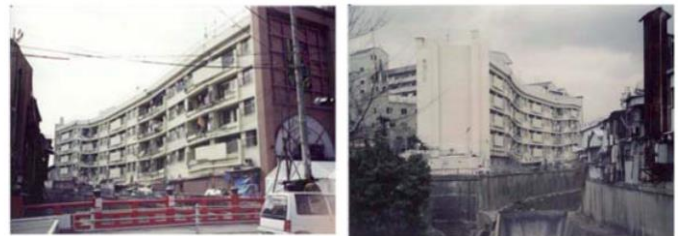
RC造・ラーメン構造の細長い住棟（5階建て）