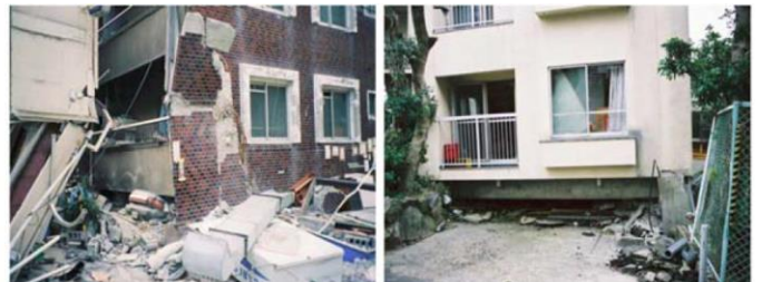
RC造ラーメン構造の駐車場 ピロティ型マンション