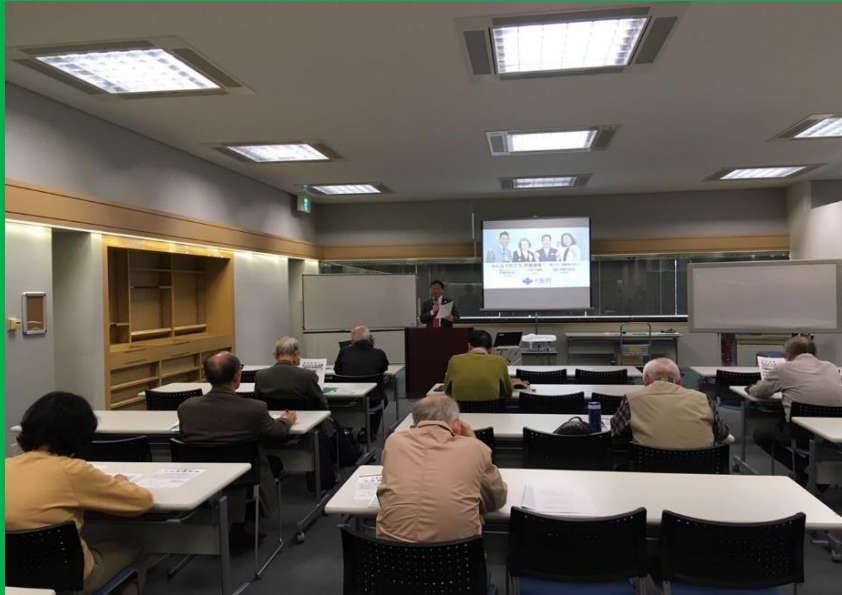
特殊詐欺被害防止DVD（大阪府作成）を使用しながら『出前講座』を開催している状況 （平成30年11月20日 大阪府立中央図書館）

「大阪府安全なまちづくり推進会議」構成員の大阪府金融機関防犯対策協議会の会員である株式会社りそな銀行様では、府内の各地で『出前講座(金融犯罪防止)』を開催されており、高齢者等の皆様に特殊詐欺に対する注意を呼び掛けていただいています。