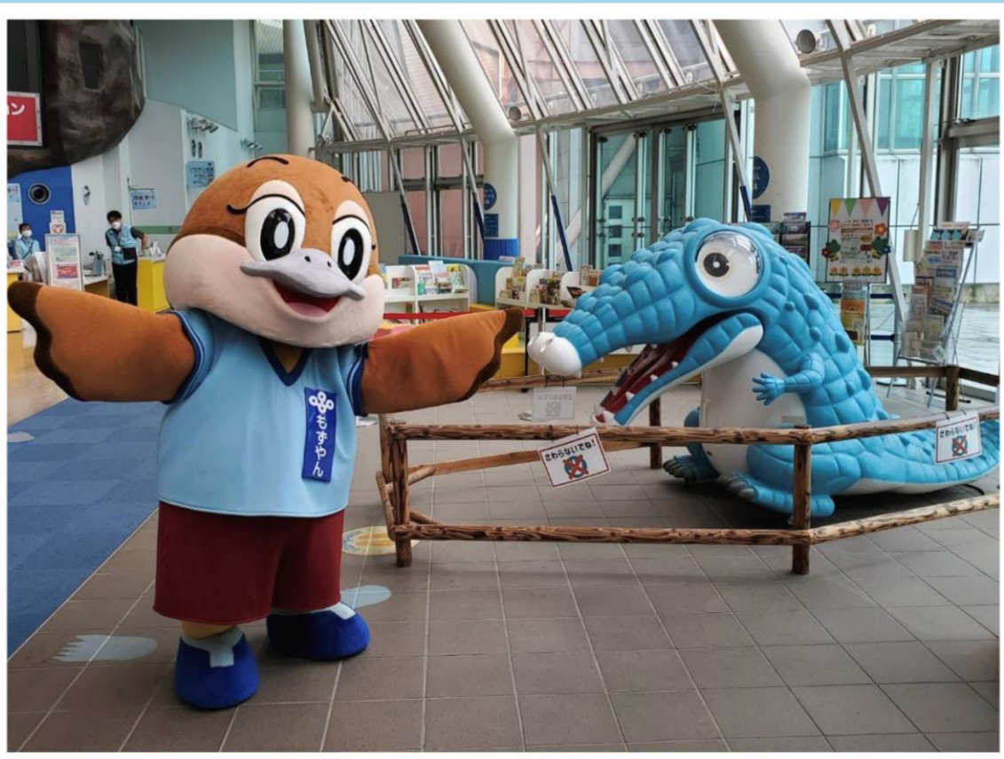
もずやんによる啓発物品の配布