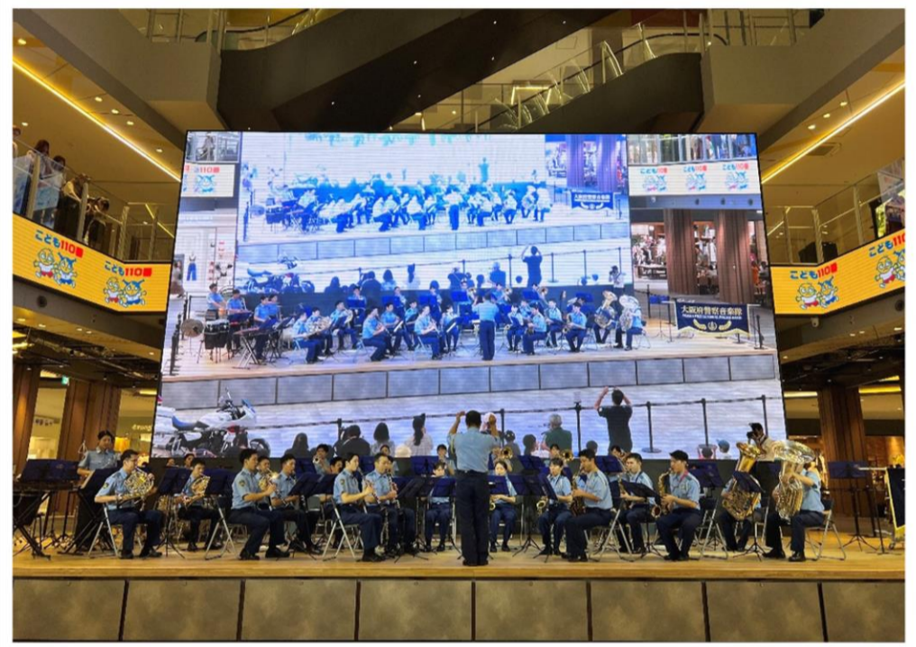
大阪府警察音楽隊による演奏