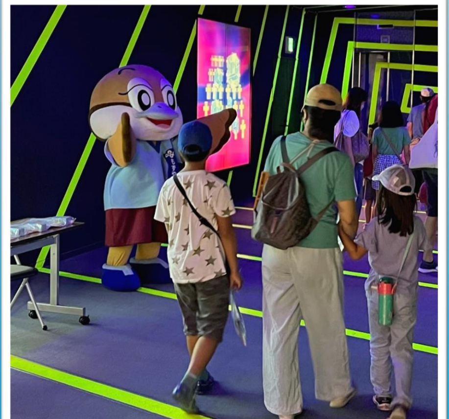
もずやんによる啓発物品の配布