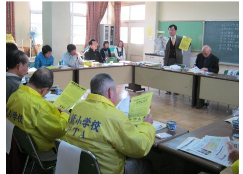
高鷲小学校区地域安全センター（羽曳野市）

昨年12月13日、PTA、子どもの安全見まもり隊、青少年健全育成連絡協議会の方々などが参加して、より一層連携したネットワークづくりを目的に「ボランティア交流会」が行われました。子どもの安全や地域防犯などに関する意見が活発に出されました。