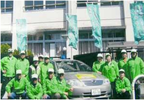
竹濑地区地域安全センター（八尾市）

登下校時の子どもの安全見守り活動を主な目的として平成20年に「青色防犯パトロール」を開始しました。現在、青色の回転灯は、子どもたちの安全を見守るだけでなく、地域の安全のシンボルとして子どもたちとの交流を担っています。