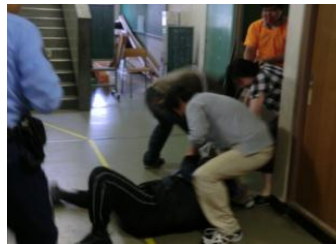
横山小学校区地域安全センター（和泉市） 【平成23年6月10日】 教職員が不審者を取り押さえる！