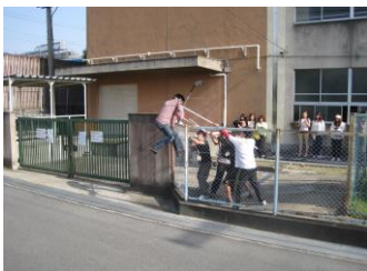
池島校区地域安全センター（東大阪市） 【平成23年5月20日】 不審者が裏門から侵入！

地域安全センターの方々に積極的に参加いただき、不審者対応訓練等の取り組みが行われました。