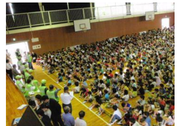
津田南校区地域安全センター（枚方市） 【平成23年6月22日】 子どもの安全見まもり隊との交流！