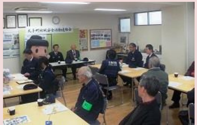
磯長・山田小学校区地域安全センター（太子町）

2月26日、磯長（しなが）・山田小学校区地域安全センターに地域の方々、太子町役場、富田林警察署、富田林土木事務所が一堂に会し、地域安全センターの活動と交番勤務員との連携等について、意見交換を行いました。地域安全センターを拠点として地域防犯活動の効果的な運用等について検討されています。