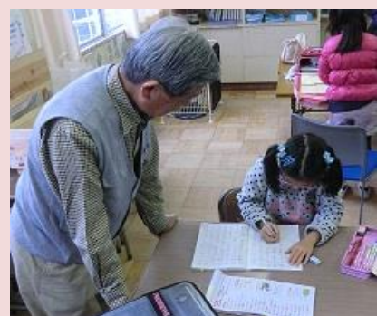
緑ヶ丘小学校区地域安全センター（和泉市）

緑ヶ丘小学校区地域安全センターでは、毎週月曜日の放課後に、地域のボランティアの皆さんが、子どもたちに勉強や木工作り等を教えています。地域安全センターを活用して、地域の絆が深まっています。