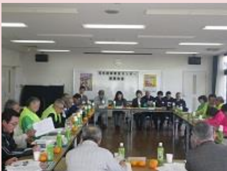
葦原小学校区地域安全センター（茨木市）

3月9日、葦原（あしはら）小学校区地域安全センターにおいて、茨木市内の地域安全センター（6カ所）や茨木市、茨木警察署、茨木土木事務所が出席し、平素の活動内容の報告や課題の発表など市内の防犯力の向上に向けた意見交換会が開催されました。