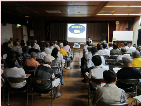
招提校区地域安全センター（枚方市）

9月14日、招提校区地域安全センターにおいて、車上・部品ねらいの防犯対策等の防犯講習と地震・津波対策の防災講習が実施されました。防犯と防災をコラボレーションさせるなど、地域安全センターが核となって、地域の方々への情報提供に活用されています。