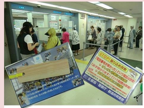
銀行内での配布の様子（和泉市）

10月15日、和泉市内の銀行と警察署が連携し、地元の小学生が地域安全センターで作成した「笑働しおり（振り込め詐欺撲滅チラシ入り）」を銀行の窓口やATMコーナーで配布しました。様々な工夫を凝らした防犯の取組みに地域安全センターが活用されています。