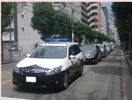
江坂企業協議会（吹田市）

8月23日、江坂企業協議会が「安全で住みやすいまちはビジネスがしやすいまち。社員や車、財産を活かして地域に貢献することが企業の責任。」と青色防犯パトロール活動を開始されました。