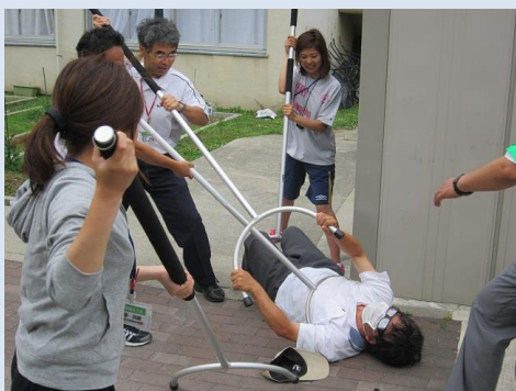
四條畷南小学校（四條畷市）

6月19日、地域安全センターの設置校である四條畷南小学校において、市長、市教育委員会、四條畷警察署、小学校教職員や小学校に設置されている地域安全センターの構成員など、子どもの安全に携わる関係者が多数参加し、不審者対応訓練が行われました。