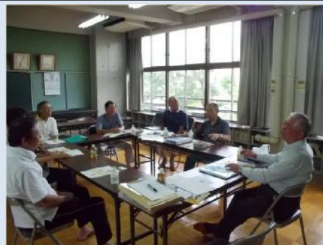
高辺地域安全センター（富田林市）

7月16日、高辺地域安全センターにおいて、青色防犯パトロール活動をこれから始めようと検討している方が、実際に活動をされている方の生の声を聴くため意見交換を行いました。地域安全センターを核として青パト活動が広がりを見せています。