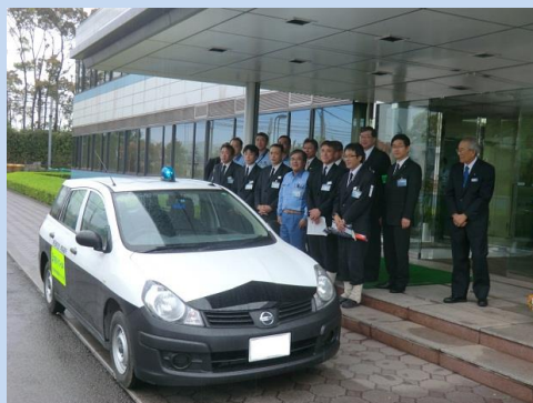
新日鐵住金堺製鉄所（堺市）

4月24日、新日鐵住金堺製鉄所の従業員たちが「企業も地域を守ろう！」と青色防犯パトロール隊を結成し、地元である堺市三宝校区内を中心にパトロール活動を開始しました。