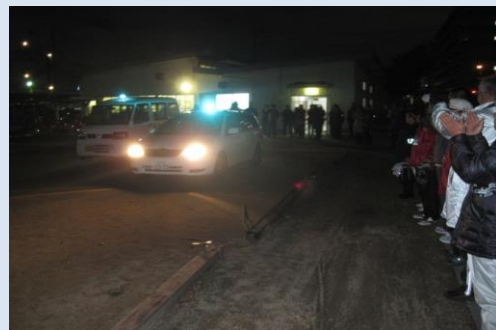
鴻池東校区地域安全センター（東大阪市）

昨年12月28日の歳末警戒の際、地域の皆さんによる青色防犯パトロール車の出発式が行われました。既に地域安全センターが立ち上がり活発な活動が行われておりますが、さらに青色防犯パトロール活動が加わりました。