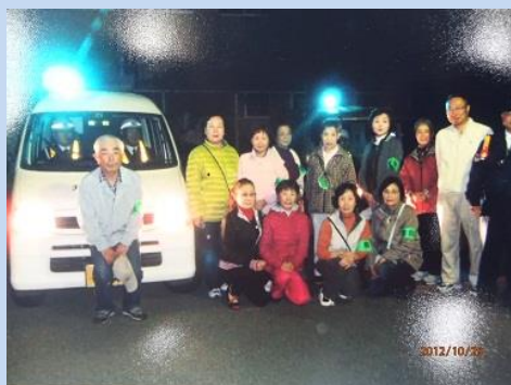
ダイハツ工業株式会社（池田市）

昨年10月10日にダイハツ工業株式会社において、青色防犯パトロール隊が発足しました。地域の方々との夜間合同パトロールを実施するなど、地域と一体となった地域防犯力の向上に企業として取り組んでいます。