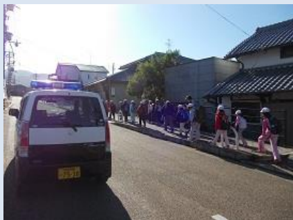
磯長・山田小学校区地域安全センター（太子町）

昨年11月16日、磯長小学校で全校児童が二上山登山に挑戦した際、地域安全センターにボランティアの方々や町役場の職員が集合し、事故防止等の注意事項を伝達した後、登山に向かう児童の見守り活動を実施しました。