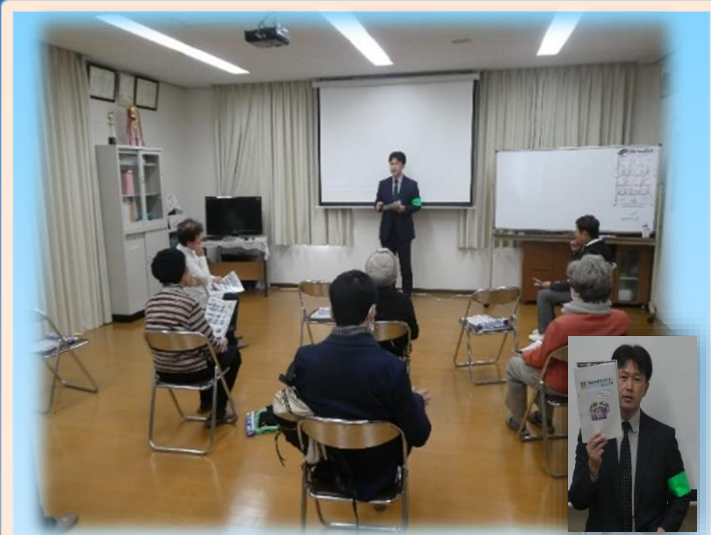
防犯マニュアルを使用した特殊詐欺被害防止教室 (大阪市北区)

西天満地域安全センターにおいて行われた100歳体操の参加者の方々を対象に、天満警察署防犯係による防犯マニュアルを使用した特殊詐欺被害防止教室が開催され、参加者から特殊詐欺の手口や防止方法についてよく理解できたなどのお声があがっていました。