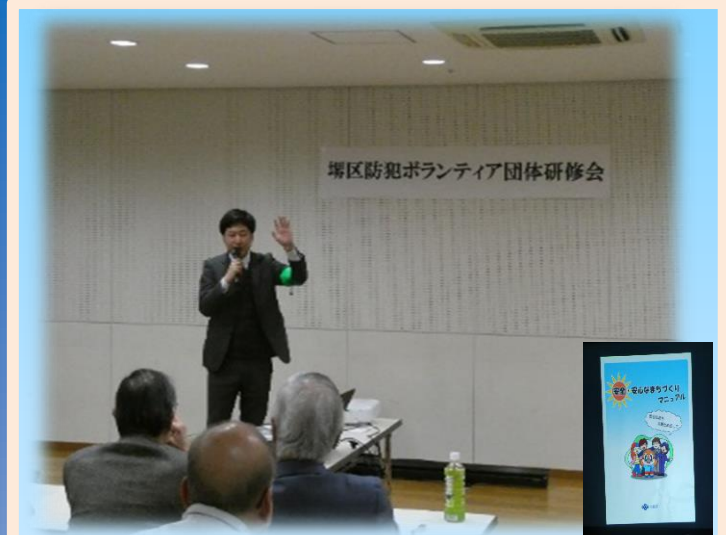
防犯マニュアルを使用した子ども・女性犯罪被害防止研修 (堺市堺区)

西天満地域安全センターにおいて行われた100歳体操の参加者の方々を対象に、天満警察署防犯係による防犯マニュアルを使用した特殊詐欺被害防止教室が開催され、参加者から特殊詐欺の手口や防止方法についてよく理解できたなどのお声があがっていました。