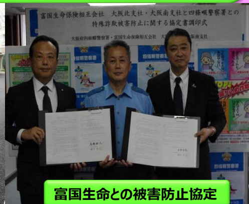
富国生命との被害防止協定

大阪府では特殊詐欺被害防止のため、特殊詐欺対策機器普及促進事業に取り組んでいます。