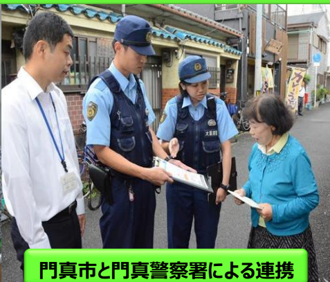
門真市と門真警察署による連携