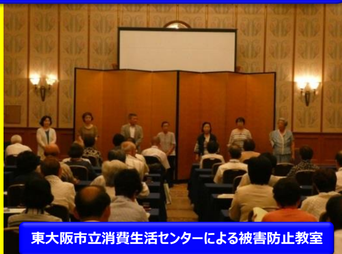
東大阪市立消費生活センターによる被害防止教室