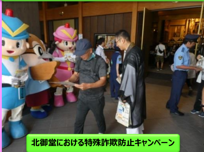
北御堂における特殊詐欺防止キャンペーン

○大阪府立堺工科高等学校ボランティア部の学生の皆様に特殊詐欺被害防止啓発用の線香を作っていただき、北御堂（大阪市中央区『本願寺津村別院』）にお参りに来られたご家族に対して、被害防止を呼びかけました。