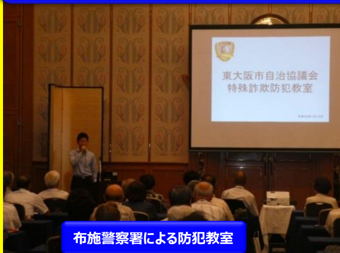
布施警察署による防犯教室