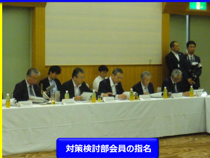
対策検討部会員の指名