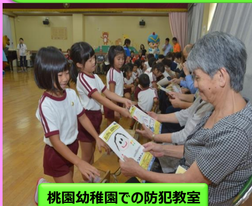
桃園幼稚園での防犯教室