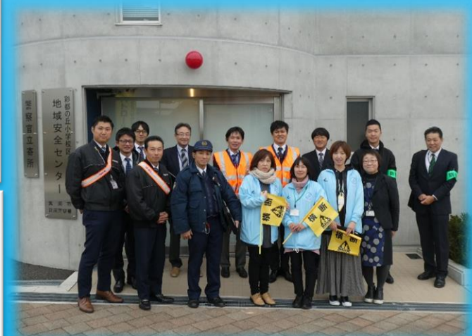
従業員と地域の皆さんの様子