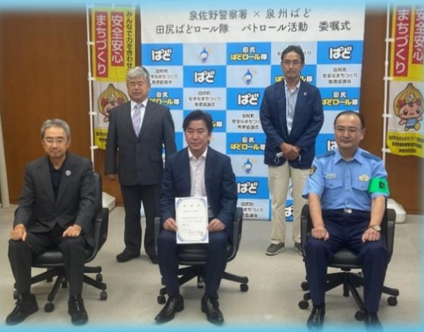
ぼどロール隊委嘱式の様子

ぼどんなさんからも、「地域貢献が出来て、非常に誇らしく思う」との声があがっているそうです。