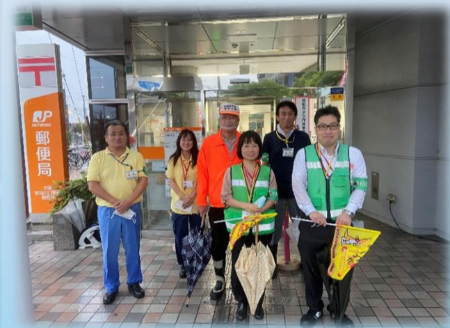
郵便局員と地域の皆さんの様子