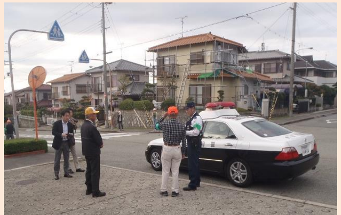
児童誘拐想定訓練（豊能町）

子どもの登下校時の安全が再認識されている中、訓練された方々からは、今後も定期的に訓練に参加していきたいなど大きな反響がありました。