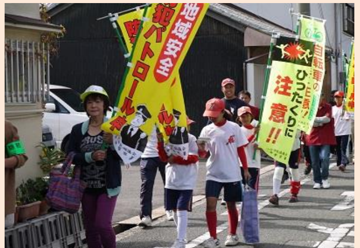
春木地区市民協議会による防犯パトロール（岸和田市）

10月25日、校区内の町会、各種団体で構成される春木地区市民協議会が防犯パトロールを実施しました。