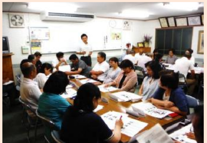
美園地区地域安全センター（八尾市）

八尾市において、7月9日に「高安地区地域安全センター」、7月24日に「美園地区地域安全センター」が開設しました。