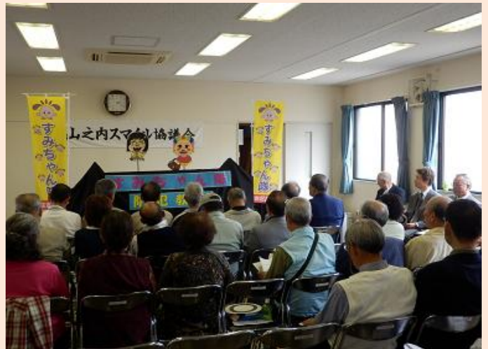
山之内地域安全センター（大阪市住吉区）

開所式では、区役所地域課「すみちゃん隊」によるひったくり防止についての紙人形劇が実施され、参加した住民の防犯意識を高めました。