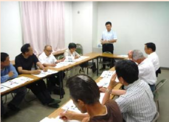
高安地区地域安全センター（八尾市）