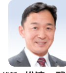
維新 松浪 武久 (泉佐野市及び泉南郡熊取町)

Q 協力金 ※1 の審査に店舗内外を含めた現地調査が有効。支給の判断に活かすべき。 A 立会調査の効果も含め検討し、協力金を迅速に届けられるよう適正な支給に取り組む。