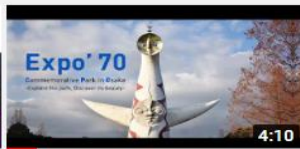
万博記念公園紹介 (Introducing Expo'70... 1.2万 回視聴・10 か月前