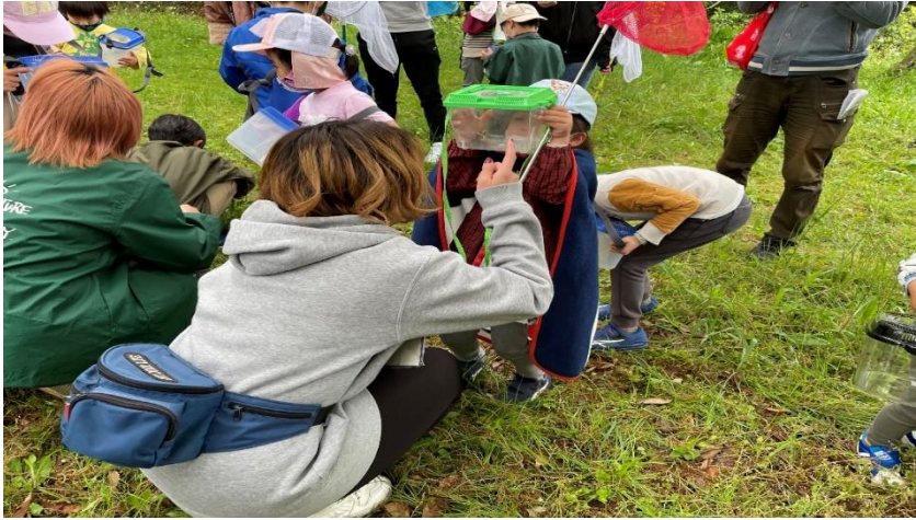
芸人と楽しむ昆虫ツアーin Moricara (R3年4月)