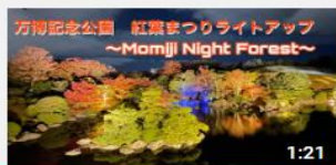
万博記念公園 紅葉まつり 夜間特別公開 日本庭園ラ... 1690 回視聴・1 か月前

YouTubeのオフィシャルチャンネルを立ち上げ、四季のイベントを中心に年間16本の動画を配信。