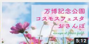
万博記念公園 ~コスモス フェスタおさんぽ~ 861 回視聴・2 か月前