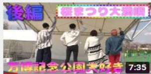
万博記念公園 桜まつり開催 中~満開になりました~後編 585 回視聴・9 か月前