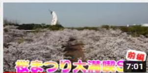
万博記念公園 桜まつり開催 中~満開になりました~ 1115 回視聴・9 か月前