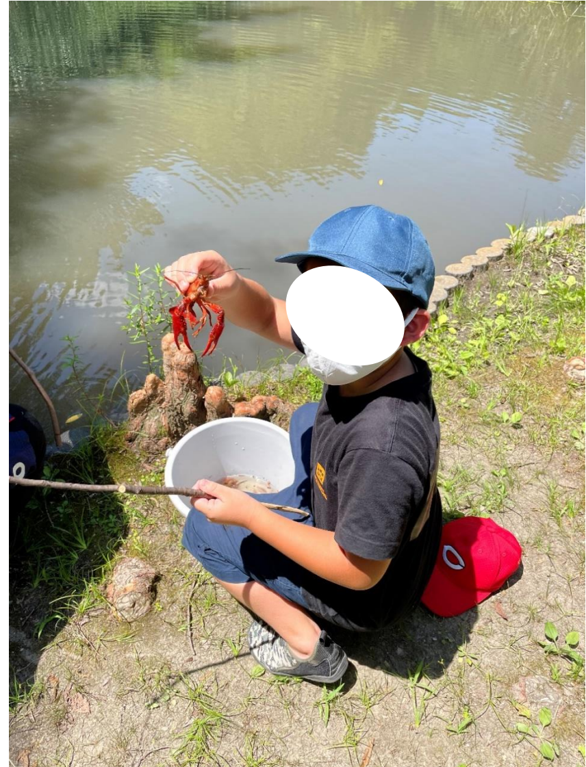
芸人と楽しむザリガニ釣り祭りin万博記念公園 (R3年7月)