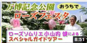
万博記念公園おうちでローズ フェスタ 平和のバラ園ス... 1267 回視聴・7 か月前