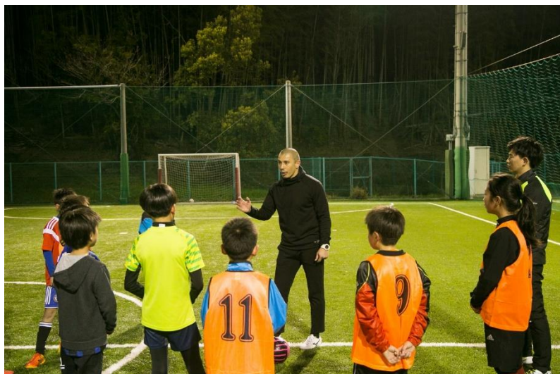
よしもとサッカースクール（H31年3月～）