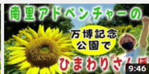
南里アドベンチャーの万博記 念公園ひまわりさんぽ 834 回視聴・5 か月前