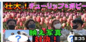
壮大！チューリップ&ポピー 映え写真対決 1026 回視聴・8 か月前