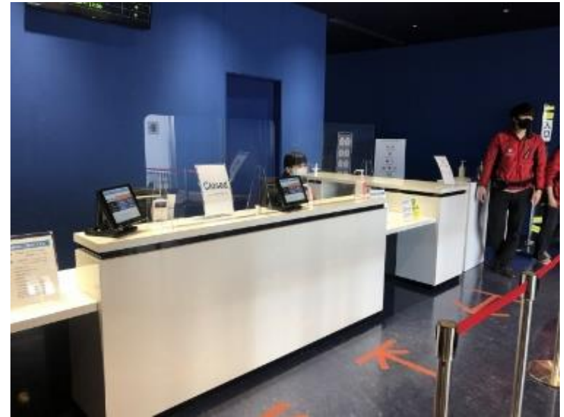
EXPO' 70パビリオン 身体的距離を促す案内