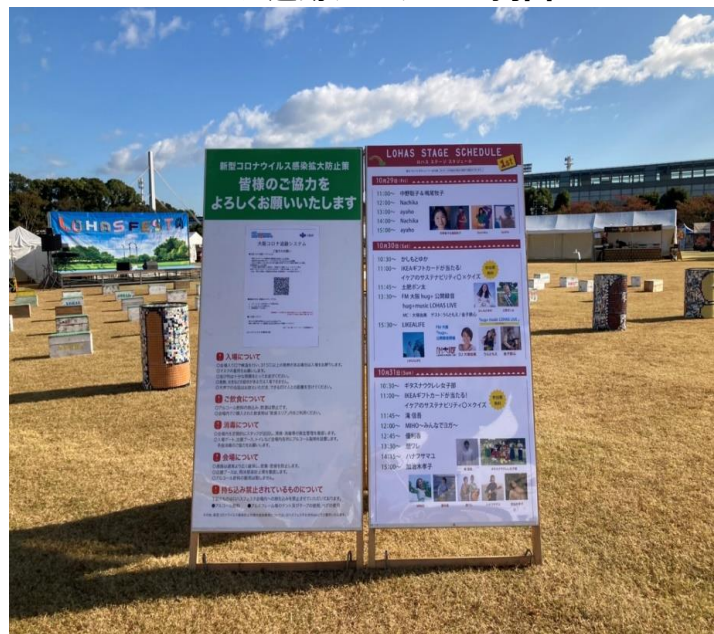
コロナ追跡システムの掲出