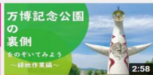
休園中の万博記念公園をのぞ いてみよう！~緑地作業編~ 1372 回視聴・7 か月前