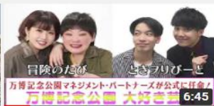
万博記念公園大好き芸人初登 場！Youtubeスタート~①... 1472 回視聴・9 か月前