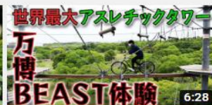
万博記念公園大好き芸人が、 「万博BEAST(ビースト)」... 1869 回視聴・5 か月前