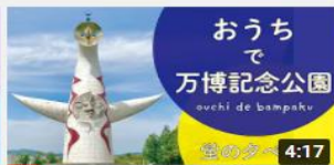
おうちで万博記念公園 蛸の タペ 1893 回視聴・6 か月前