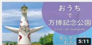
おうちで万博記念公園 ~あ じさいの森おさんぽ~ 1598 回視聴・6 か月前