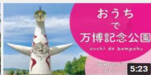
おうちで万博記念公園 ~平 和のバラ園おさんぽ~ 3347 回視聴・7 か月前