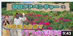
南里アドベンチャーの 万博記 念公園でパラの夏季剪定 415 回視聴・2 か月前