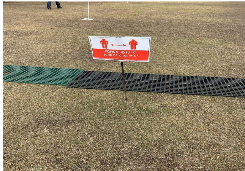
身体的距離の確保を呼びかける掲出