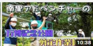
南里アドベンチャーの 万博記 念公園 剪定作業体験 636 回視聴・4 か月前 字幕