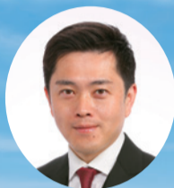
大阪府知事 吉村洋文

北朝鮮による拉致は重大な人権侵害で、未解決であり決して許されるものではありません。この問題を風化させないためにも、府民の皆さまに拉致被害者ご家族の思いを知っていただき、自分事として考えてほしいと思います。