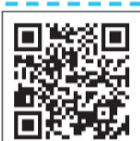
店舗情報は こちら

府庁別館のアンテナショップ「福祉のコンビニこさえたん」のほか、府内各所にこさえたんの常設販売店があります。いろいろな地域のイベントにも出店していますので、見かけた際にはぜひ手にとってお気に入りの一品を見つけてください。