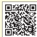
入賞作品はこちら