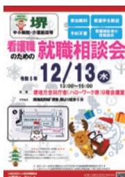
就職相談会(堺市内)チラシ

免許をお持ちで就業していない看護職の人が地域の医療機関・施設に再就業できるよう、府内各地で就職相談や情報提供を行っています。また、看護補助者(資格不要)の情報提供も行っていきます。今年度は12月と1月に開催。今後の開催日程など、詳しくはHPをご確認ください。