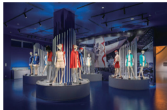
ユニホーム展示の様子

ほかにも、大阪万博のにぎわいや熱気を映像や音声により体感できるギャラリーや、万博会場を彩ったユニホーム、岡本太郎氏が制作した仮面や日本館で展示されていたリア