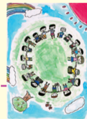
ポスター小学生部門 最優秀作品

この記事のお問い合わせ先 問 府自立支援課 ☎06(6944)9178 HP こさえたん 検索