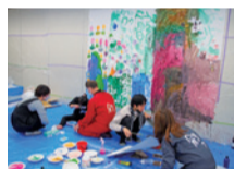
あーと工房 昨年度の様子

アートを通して人との出会いやつながりの場所となっているビッグ・アイ「あーと工房」が、このたび吹田市・豊中市に出張します。