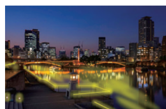
ライトアップのイメージ

天神橋のらせんスロープをライトアップし、噴水やビルの夜景を背景にゆっくりと光の色が変化する様子が楽しめます。天神橋から天満橋までの八軒家浜遊歩道はシャ