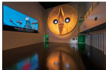
「黄金の顔」展示の様子

万博記念公園と言えば、1970年(昭和45年)大阪万博のレガシーである「太陽の塔」。この「太陽の塔」の上部に掲げられている「黄金の顔」が、実は、平成4年の改修工事で一度貼り替えられていることをご存じですか?今年8月に、別館を増設オープンしたばかりのEXPO'70パビリオンでは、改修工事で貼り替えられる前の、大阪万博当時の「黄金の顔」を展示しています。別館の1階・2階の両フロアからは、直径10.6メートルもの大きさを誇る「黄金の顔」を間近でご覧いただけます。