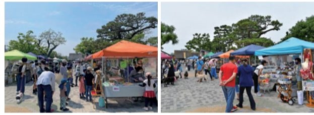
昨年度イベントの様子