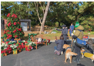
昨年度クリスマスイベントの様子

12/24(日)に150周年を迎える浜寺公園では、前日の23日と、当日の24日に、音楽やライトアップ、食を楽しめるブースなどで浜寺公園を盛り上げます。一緒に浜寺公園の150歳のお誕生日をお祝いしましょう。