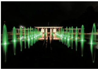
噴水のライトアップの様子