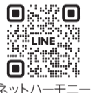
ネットハーモニー