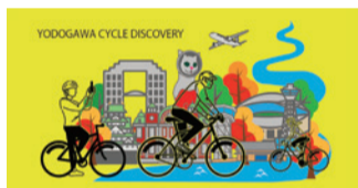
イベントのサムネイル画像

淀川沿川および周辺地域における緑豊かな地域資源や観光資源をめぐる大阪京都 淀川周遊サイクルディスカバリーが実施されています。