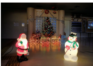
昨年度イベントの様子

山田池公園のパークセンターと浮見堂にクリスマスイルミネーションが登場します。クリスマスならではの幻想的な雰囲気をお楽しみください。