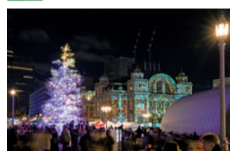
中之島公園水上劇場前 シンボルツリー