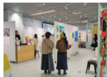
about me 昨年度の様子

作品だけでは見えてこない大切なものがたくさんあります。障がいのある人が表現した作品を、作品の作り手を支える人たちなどの背景も含めて、さまざまな角度から見つめるアート企画展を開催します。