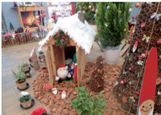
昨年度イベントの様子

自然素材で作ったクリスマスツリーや切り株サンタ、鉢物のポインセチアやコファニーなどで、大泉緑地がクリスマスの装いに包まれます。ファンタジーな世界を体感してください。