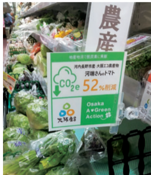
スーパーマーケット サンプラザでの表示の様子

府内の一部スーパーやレストランで、大阪産農産物にCO 2 削減率を記載したカーボンフットプリント(CFP)表示を実施中。野菜や果物を購入する際は、ぜひCFP表示商品を選んで、環境にやさしいお買い物を体験してみてください。