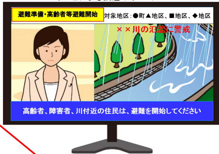
テレビによる伝達のイメージ