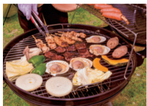
ほりご園地(手ぶらでBBQ)