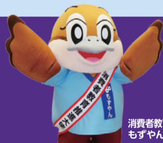
消費者教育推進大使 もずやん