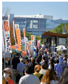
大阪産(もん)イベント

今年の秋は食に関するイベントの開催や情報発信など、さまざまな団体と協力し、大阪産(もん)の豊富な魅力をPRします。地元で採れた食材を地元で消費する「地産地消」は新鮮な農林水産物を食べられるとともに、輸送距離が短くなることでCO 2 が削減され、環境にやさしい行動につながります。大阪産(もん)を食べる・買う・体験する秋のイベント情報は府HP、メルマガ、SNSで随時発信していきます。