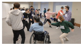
昨年度のオープンカレッジダンスコースの様子

舞台芸術に興味のある人、チャレンジしてみようと思っている人なら、だれでも参加できるワークショップです。さまざまな表現にふれながら、からだの使い方や感情の表し方などを学び、自分なりの表現と可能性を見つけます。演劇やダンスの経験がなくても、人に見られるのが恥ずかしくても、知らない人とお話しするのが苦手でも、自分にとって楽しいことが見つかるチャンスです。