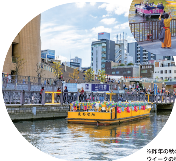
※昨年の秋の水都大阪ウィークの様子