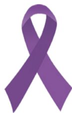
パープルリボン ロゴマーク

セミナー「女性に対する暴力のない社会をめざして」 日 11/22(水)18:00～20:00 所 ドーンセンター5階 特別会議室(地下鉄「天満橋」ほか) 定 100人 ※後日アーカイブ配信あり 申 大阪府行政オンラインシステム ひとりで悩まず、すぐにご相談ください。 ■ DVの相談 #8008(はれれば) ■ 性暴力・性被害の相談 #8891(はやくワンストップ) HP 大阪府 パープルリボン 検索 問 府男女参画・府民協働課 ☎ 06(6210)9321