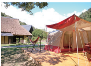
ほりご園地(オートキャンプ場)