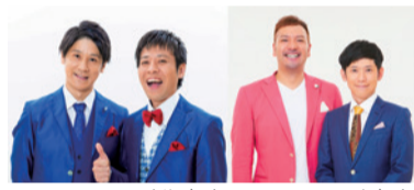
スマイルさん span!さん

明治6年に都市公園制度が制定され、日本で最初の公園として府内では浜寺公園と住吉公園が誕生しました。この秋、開設50周年記念イベントを開催。浜寺公園では植物を使ったクラフト教室や子ども向けの忍者教室など体験型プログラム、パフォーマーによるステージイベントのほかマグロの解体を間近で見れるキッチンカーや大阪産(もん)を使った多彩な「食」もお楽しみいただけます。住吉公園でもイベントを開催します。詳しくはHPをご覧ください。