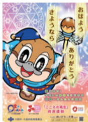
「こころの再生」府民運動ポスター