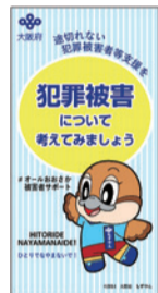
犯罪被害者週間啓発のぼり

「犯罪被害者週間」の啓発と関係図書の展示 日 11/15(水)～12/5(火)9:00～19:00 (土日祝は17:00まで) ※11/20(月)・27(月)・12/4(月)は休館日 所 府立中央図書館1階 階段下スペース(近鉄「荒本」) HP 大阪府 犯罪被害者週間 検索 問 府治安対策課 ☎ 06(6944)7506