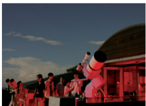
ちはや園地(星空観察会)

府民の森では、季節を感じるイベントが盛りだくさん。ちはや園地では、山麓での星空観察会などを開催します。また、ほりご園地では、日帰りBBQサイトやオートキャンプ場などが、新しくオープンしています。ぜひ府民の森へお越しください。イベント詳細や他の園地の情報は、府HPをご確認ください。※事前予約が必要な場合があります。