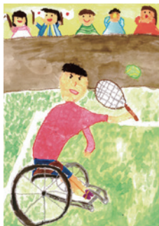
令和3年度小学生部門最優秀賞

障がいのある人とない人との心のふれあい体験をつづった作文や障がい者への理解を促進するポスターを募集します。入賞者には、知事から賞状などを贈呈します。