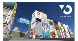
バーチャル大阪のイメージ

この記事のお問い合わせ先 問 財政課 ☎ 06(6944)9018 HP 大阪府 令和4年度当初予算 検索