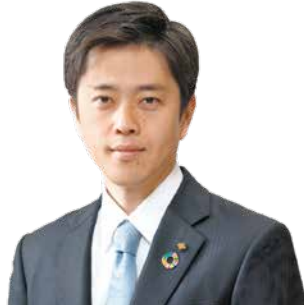
大阪府知事 吉村 洋文

令和4年度は、いまだ続くコロナとの闘いを何としても克服し、大阪の再生・成長を実現するための取り組みに全力を尽くします。