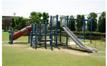
川俣スカイランドには、すべり台などの子ども向け遊具が充実。