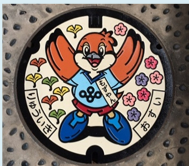
大阪府流域下水道 50周年を機に製作した「もずやん」のデザインマンホール。

また、最近では、デザインマンホールの写真やデザインの由来などを記載したコレクションカードである「マンホールカード」が全国各地の自治体で発行され、ブームの兆しをみせています。マンホールカードは、実際に処理場等に足を運んでいただくことでGETできます。 (全国のマンホールカード配布場所一覧⇒ http://www.gk-p.jp/mhcard.html )