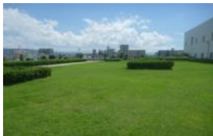
鴻池スカイランド。処理施設の屋上に広大な芝生が広がります。