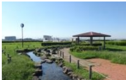
大井ふれあいらんどから市街地が一望できます。