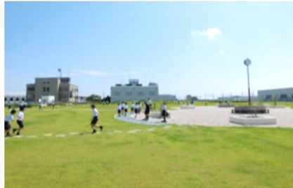
2016年4月オープンの高槻スカイランド。新幹線が間近で見られる珍しい処理場。