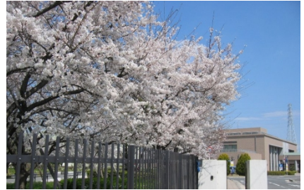
渚水みらいセンターいこいの広場。春は広場の桜が満開に。