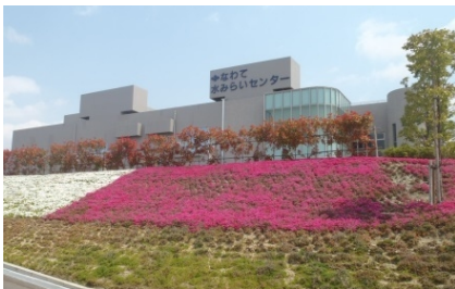
なわて水みらい緑地。きれいな花が鑑賞できます。