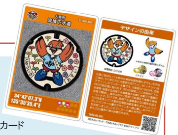
大阪府のマンホールカード

日本の多くの自治体では、その地域の名産や特色をモチーフにしているデザインマンホールが導入されています。大阪府内の自治体のマンホールも魅力的なデザインがたくさんありますので、ぜひお住まいの街のデザインマンホールを探してみてください。