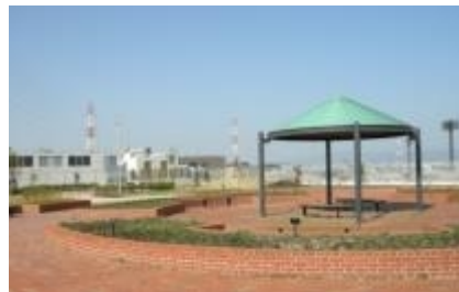
今池水みらいセンター風の広場。レンガが敷き詰められたイングリッシュガーデン。