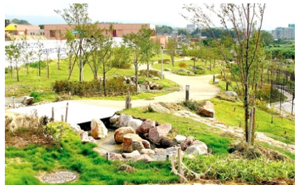
緑とせせらぎ水路に癒される狭山水みらいセンターせせらぎの丘・かがやき広場。