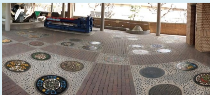
「下水道ふれあいプラザ」には府内自治体のデザインマンホールが展示されています。