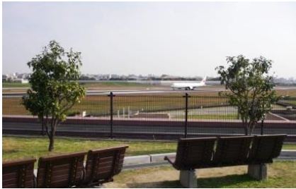
スカイランド HARADA からは飛行機の離発着が見られます。

水みらいセンターは、その広大な敷地を有効利用して、処理施設の上を公園などにして府民の方々が楽しめるスペースにしています。府民のみなさんのゆとりと潤いの空間として、地域社会に貢献する施設となることを目的としています。原田、高槻、鴻池、川俣、大井の「スカイランド」をはじめ、各水みらいセンターでせせらぎや広場等を一般に開放していますので、ぜひ一度お越しください。