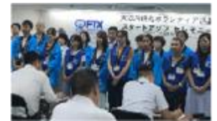
ウクライナ避難民ワンストップ窓口の設置