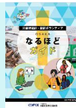
災害時通訳・翻訳ボランティア ガイドブック