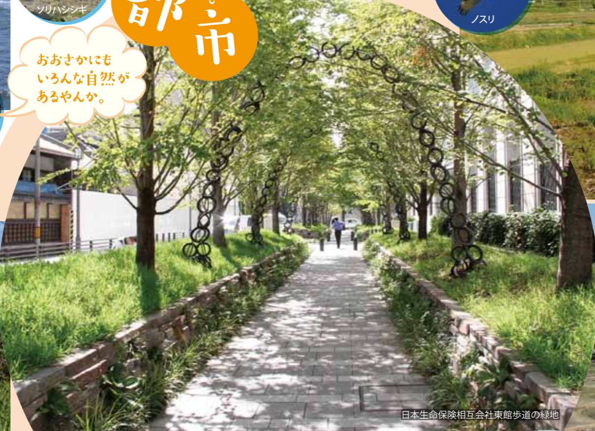
日本生命保険相互会社東館歩道の緑地

おおさかの街はビルばかりで、生きものはいないと思いませんか？ そんなことはありません。人々の努力と工夫で、ビル街の緑地でも 生きものが集い、生物多様性と体感できる場所がつくられています。