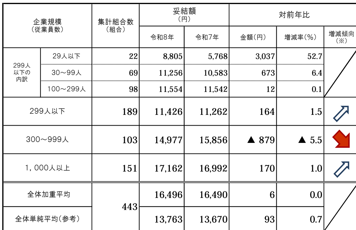
(表2) 企業規模別妥結状況

※増減傾向は、5%以上の増減率を太矢印、1%以上5%未満の増減率を細矢印で示しています。