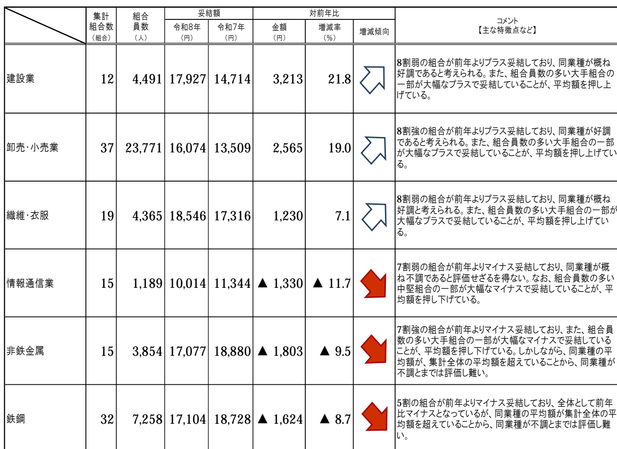
(表3) 前年に比べ増減率の大きい上位3業種と下位3業種

なお、集計組合数が10組合以上あった業種のうち、前年に比べ増減率の大きい業種は下記表のとおりです。