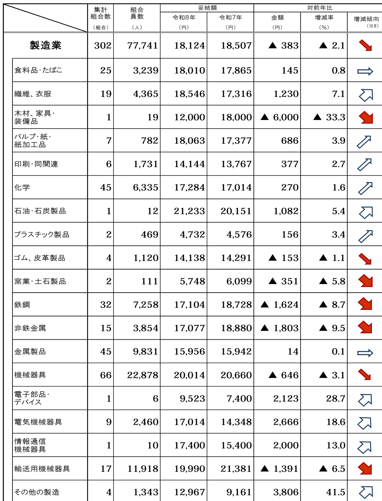
(表4-1) 産業別の妥結状況(製造業)【加重平均】

※1 集計組合数が少ない業種については、平均額の精度が十分に確保できないとみられることから、結果の利用に当たっては御留意ください。