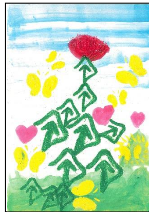
令和7年度小学生部門最優秀賞作品