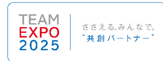
その他パターン例