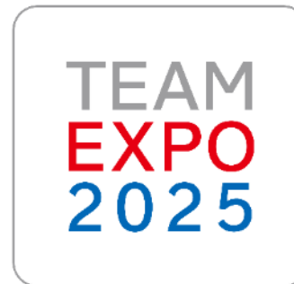
専用ロゴマーク (基本形)

※ロゴマーク使用については、使用届出書の提出が必要となります ※商用・資金調達目的での使用を除きます