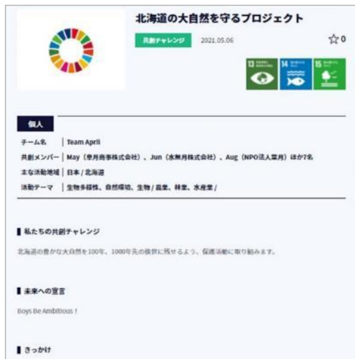
取り組み内容掲載イメージ