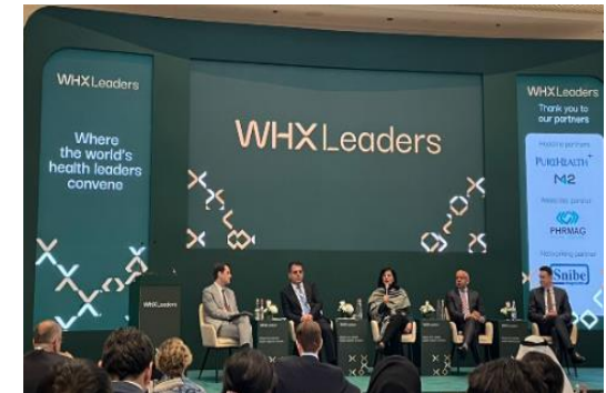
2026年2月 WHX Leaders Dubai

WHX Leaders Osaka 実行委員会(大阪府、大阪市、インフォーママーケティングジャパン株式会社)