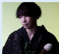
もさを。さん (シンガーソングライター)