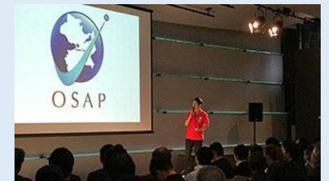
OIH スタートアップアクセラレーションプログラム