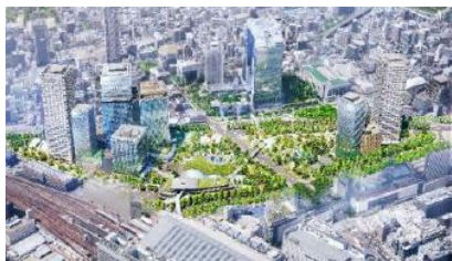
うめきた2期完成予定イメージ