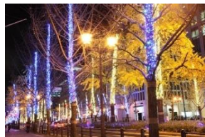
御堂筋イルミネーション 出典：（公財）大阪観光局HP