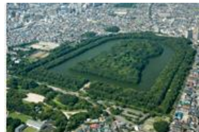
百舌鳥・古市古墳群（仁徳天皇陵古墳）