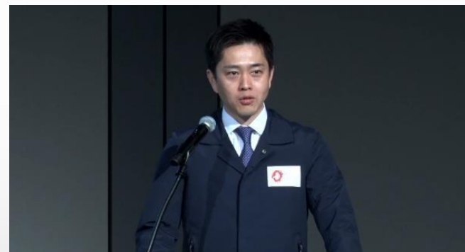
SDGsの視点から2025年大阪・関西万博について講演