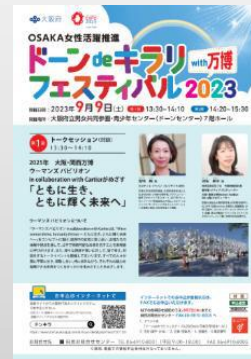
OSAKA女性活躍推進 ドーンdeキラリ フェスティバル 2023