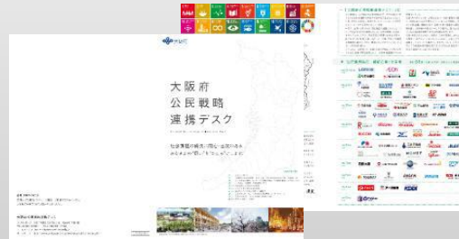
公民戦略連携デスクパンフレット