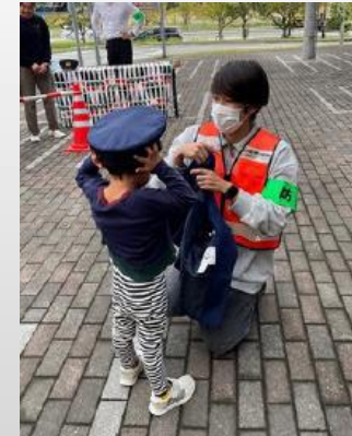
大阪学生ボランティアネットワーク「みくす」による防犯活動の実施