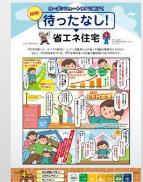
続報！待ったなし！ 省エネ住宅チラシ