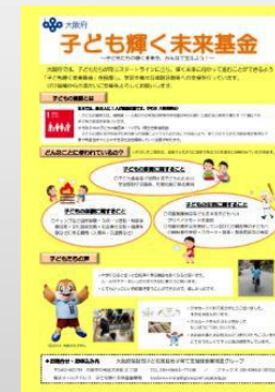
子ども輝く未来基金