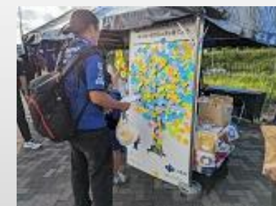
各イベント会場で、SDGsと大阪・関西万博をPR