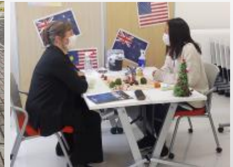
実践的英語体験活動推進事業（グローバル体験プログラム）