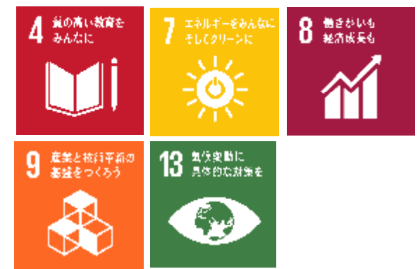
※関連ゴールは一例です。