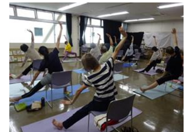
「10歳若返り」展示関連イベント ヨガ体験でリフレッシュ