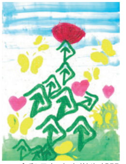
令和7年度小学生部門 最優秀賞作品