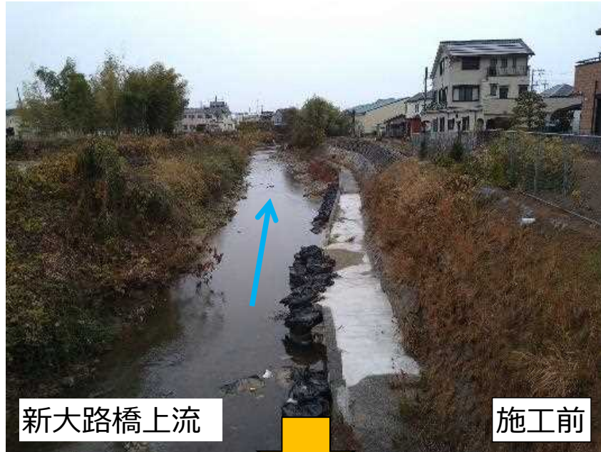
牛滝川河川改修 (岸和田市域)