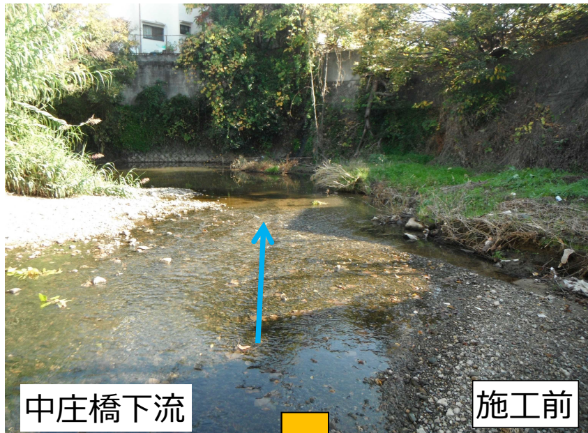
佐野川護岸補修 (泉佐野市域)