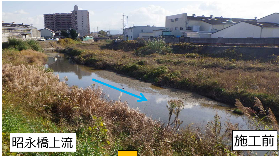
近木川堆積土砂除去 (貝塚市域)