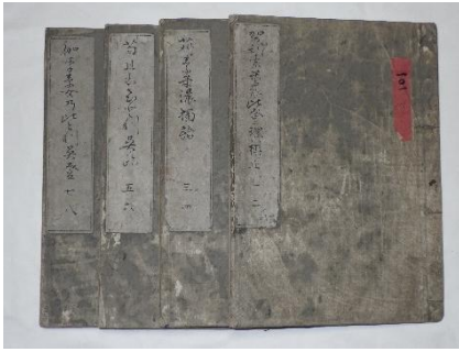
図5 中盛彬 著『伽李素免獨語』(自筆稿本)