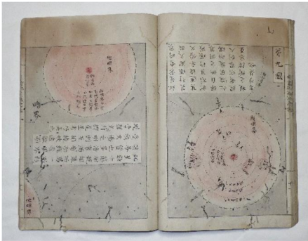
図7 中盛彬 著『もつつみはしら』(版本)