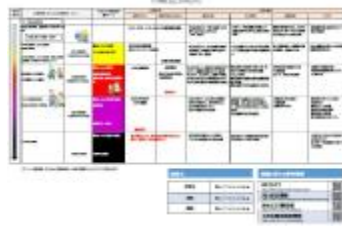
ワークシート(ひな形)