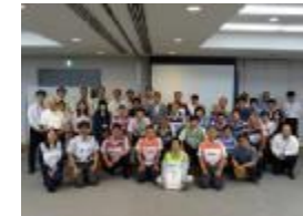
完成したタイムラインを祝う河南町の職員ら