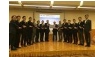
完成したタイムラインを手交する寝屋川流域市長ら