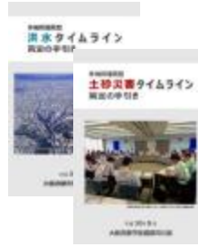
タイムライン策定の手引き (洪水編・土砂災害編)