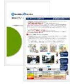
コミュニティ・タイムライン の啓発リーフレット