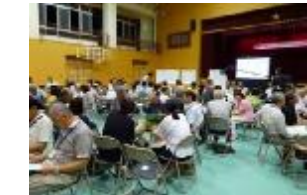
ワークショップを行う貝塚市の地域住民ら（地住宅地区）