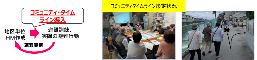
コミュニティタイムライン策定状況

プロジェクト立ち上げ（H29.3）以降、広域タイムライン、市町村タイムラインの策定が進む一方、コミュニティタイムラインについては、対象となる地区が非常に多くなるため、令和3年度からモデル地区を選定して市町村と地域が行う作成を支援し、市町村職員のノウハウ取得による市町村管内での展開を図っている。 令和4年度は引き続き コミュニティタイムライン未作成の市町に対する支援 に加え、これまでに 地区単位ハザードマップのみ作成済の地域 に対し、コミュニティタイムライン作成の取組を拡げていく。